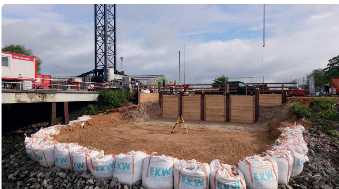
Der Standort ist vermessen